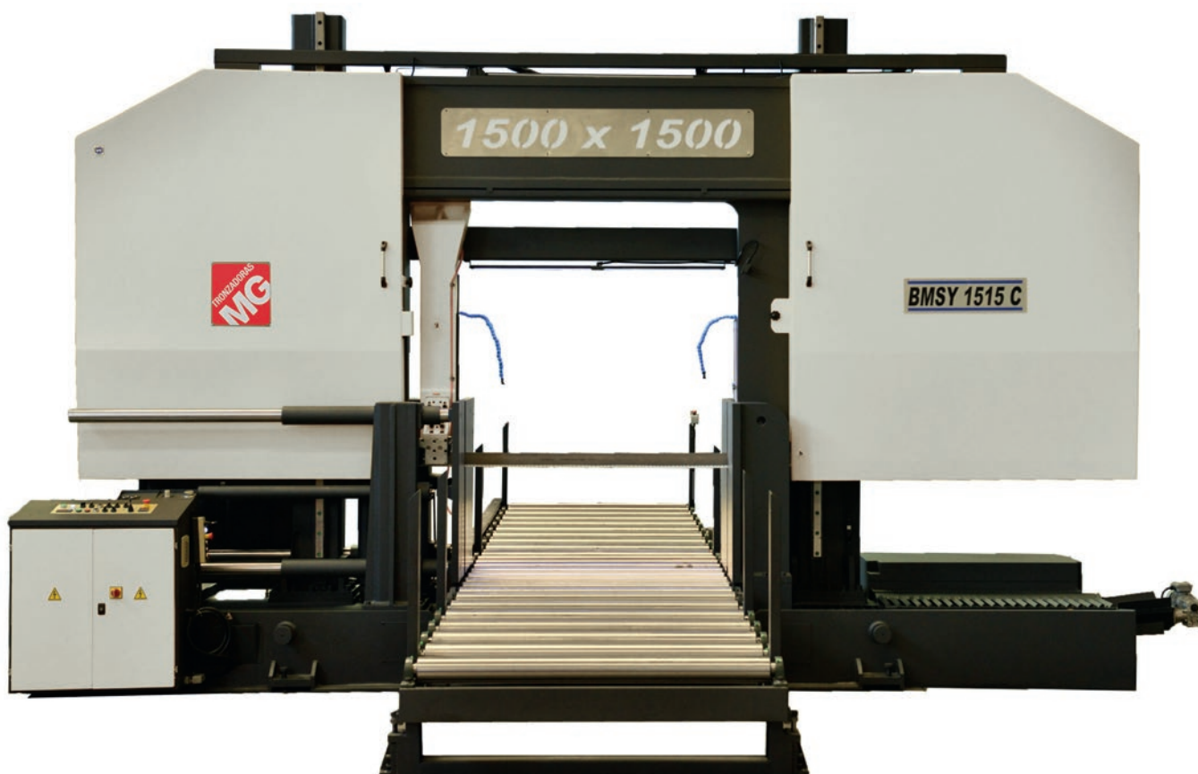
Sierra de cinta de doble columna.