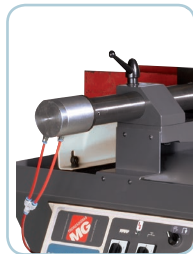
Mordaza neumática opcional Optional pneumatic clamp

Sierra de cinta manual robusta para cortes de hierro y acero entre 0° y 60° derecha.