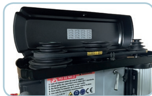
Taladro de sobremesa.